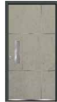
Stone 03 geschlossen Lisenen in Edelstahl Griffschale integriert