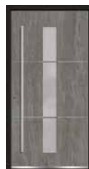
Basalt 05 Lisenen in Edelstahl Glas sandgestrahlt mit klaren Streifen