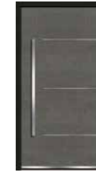
Steel 02 geschlossen Lisenen in Edelstahl