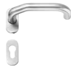
450 Edelstahl matt