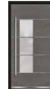
Steel 06 Lisenen in Edelstahl Glas sandgestrahlt