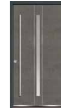
Steel 04 Lisenen in Edelstahl Glas sandgestrahlt