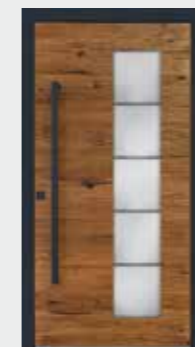
Eiche hell 02 Glas sandgestrahlt mit klaren Streifen