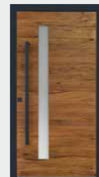
Eiche hell 03 Glas sandgestrahlt