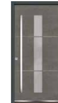
Steel 05 Lisenen in Edelstahl Glas sandgestrahlt mit klaren Streifen