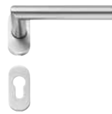
460 Edelstahl matt