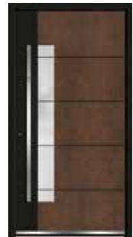
Corten 07 Teilfläche in RAL 9005 Tiefschwarz Feinstruktur Lisenen in Schwarz Glas sandgestrahlt mit klaren Streifen