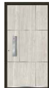
Marmor 03 geschlossen Lisenen in Edelstahl Griffschale integriert