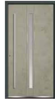
Stone 04 Lisenen in Edelstahl Glas sandgestrahlt