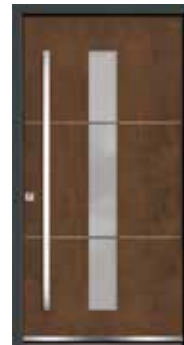
Corten 05 Lisenen in Edelstahl Glas sandgestrahlt mit klaren Streifen