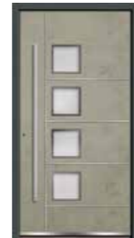
Stone 08 Lisenen in Edelstahl Glas sandgestrahlt mit klarem Rand