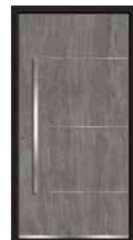
Basalt 02 geschlossen Lisenen in Edelstahl