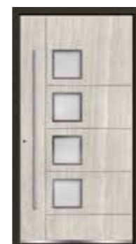
Marmor 08 Lisenen in Edelstahl Glas sandgestrahlt mit klarem Rand