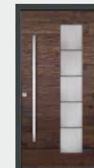
Eiche dunkel 02 Glas sandgestrahlt mit klaren Streifen