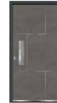
Steel 03 geschlossen Lisenen in Edelstahl Griffschale integriert