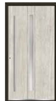
Marmor 04 Lisenen in Edelstahl Glas sandgestrahlt