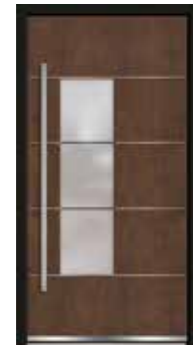
Corten 06 Lisenen in Edelstahl Glas sandgestrahlt