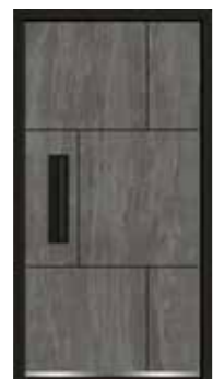
Basalt 03 geschlossen Lisenen in Schwarz Griffschale integriert