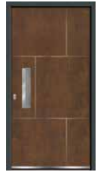
Corten 03 geschlossen Lisenen in Edelstahl Griffschale integriert