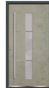
Stone 05 Lisenen in Edelstahl Glas sandgestrahlt mit klaren Streifen