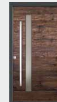
Eiche dunkel 03 Glas sandgestrahlt

Bitte beachten Sie, dass aus drucktechnischen Gründen Farbabweichungen im Katalog möglich sind. Bei den NaturArt Modellen handelt es sich um ein Naturprodukt. Farb- und Glanzgradabweichungen sind unvermeidbar. Die Maserung und die Anordnung von Ästen und Einschlüssen bei Altholz Modellen unterscheiden sich von Türblatt zu Türblatt. Wir empfehlen die Bemusterung nach Original-Farbmuster.