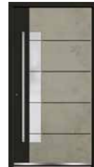
Stone 07 Teilfläche in RAL 9005 Tiefschwarz Feinstruktur Lisenen in Schwarz Glas sandgestrahlt mit klaren Streifen