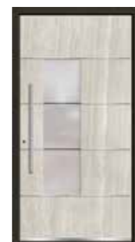
Marmor 06 Lisenen in Edelstahl Glas sandgestrahlt