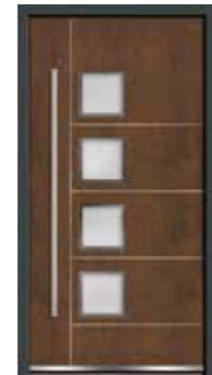
Corten 08 Lisenen in Edelstahl Glas sandgestrahlt mit klarem Rand