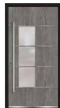
Basalt 06 Lisenen in Edelstahl Glas sandgestrahlt