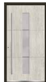
Marmor 05 Lisenen in Edelstahl Glas sandgestrahlt mit klaren Streifen