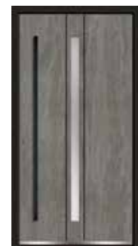
Basalt 04 Lisenen in Edelstahl Glas sandgestrahlt