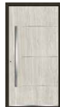
Marmor 02 geschlossen Lisenen in Edelstahl