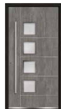
Basalt 08 Lisenen in Edelstahl Glas sandgestrahlt mit klarem Rand