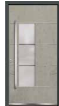
Stone 06 Lisenen in Edelstahl Glas sandgestrahlt