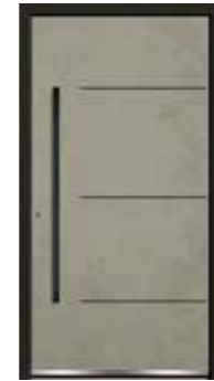
Stone 02 geschlossen Lisenen in Schwarz