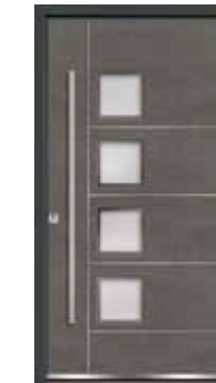
Steel 08 Lisenen in Edelstahl Glas sandgestrahlt