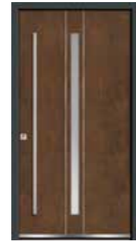
Corten 04 Lisenen in Edelstahl Glas sandgestrahlt