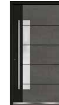
Steel 07 Teilfläche in RAL 9005 Tiefschwarz Feinstruktur Lisenen in Schwarz Glas sandgestrahlt mit klaren Streifen