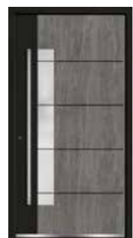
Basalt 07 Teilfläche in RAL 9005 Tiefschwarz Feinstruktur Lisenen in Schwarz Glas sandgestrahlt mit klaren Streifen