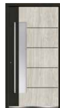
Marmor 07 Teilfläche in RAL 9005 Tiefschwarz Feinstruktur Lisenen in Schwarz Glas sandgestrahlt mit klaren Streifen