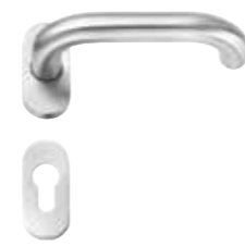
470 Edelstahl matt