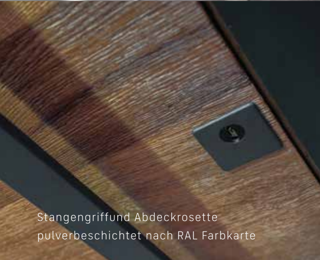
Stangengriff und Abdeckrosette pulverbeschichtet nach RAL Farbkarte