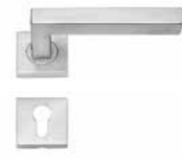
82250 Edelstahl matt