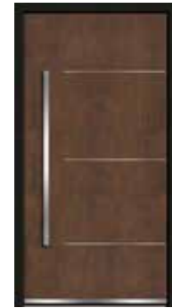
Corten 02 geschlossen Lisenen in Edelstahl